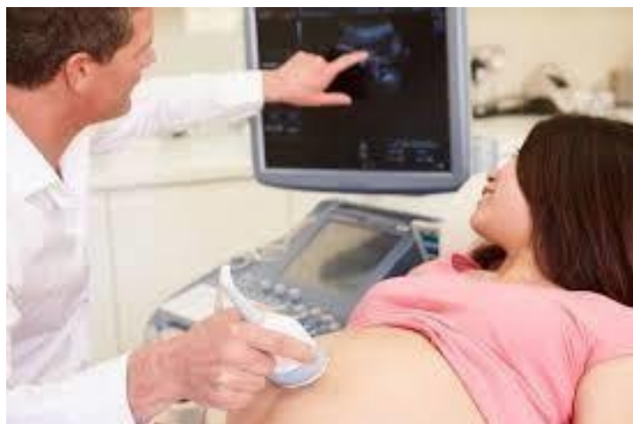
Gambar 3.1 Dokter Melihat Perkembangan Bayi