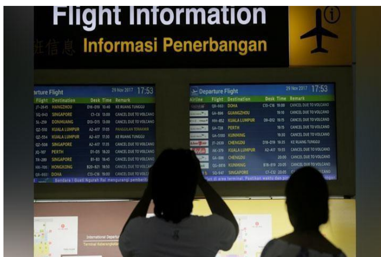
Gambar 3.2 Jadwal Pesawat

Dengan adanya komputer tentunya seluruh jadwal mulai dari penerbangan ataupun kereta dan transportasi lainnya dapat terpantau secara luas, contoh kecilnya yaitu jadwal pesawat yang tertera pada layar atau monitor besar.