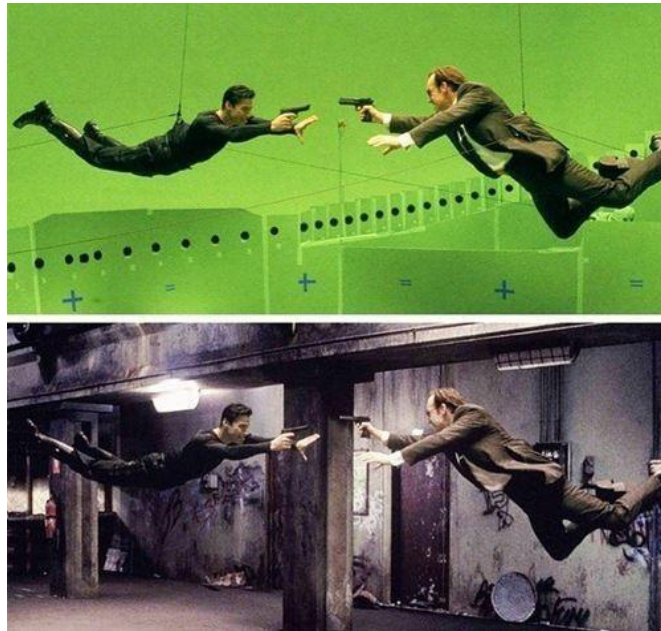
Gambar 3.8 Efek Green Screen

benar-benar berubah dan menjadi tontonan yang sering disaksikan masyarakat.