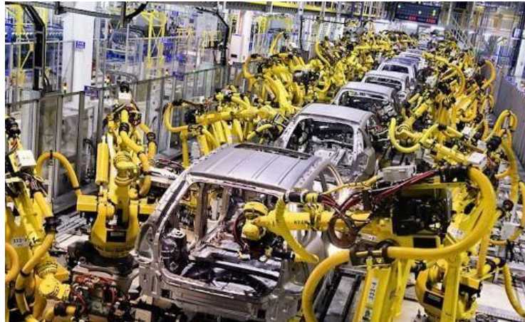
Gambar 3.6 Industri Mobil

Berbagai perusahaan industri pastinya komputer yang memegang kendali pada mesin-mesin yang telah didesain khusus dengan penggunaannya.