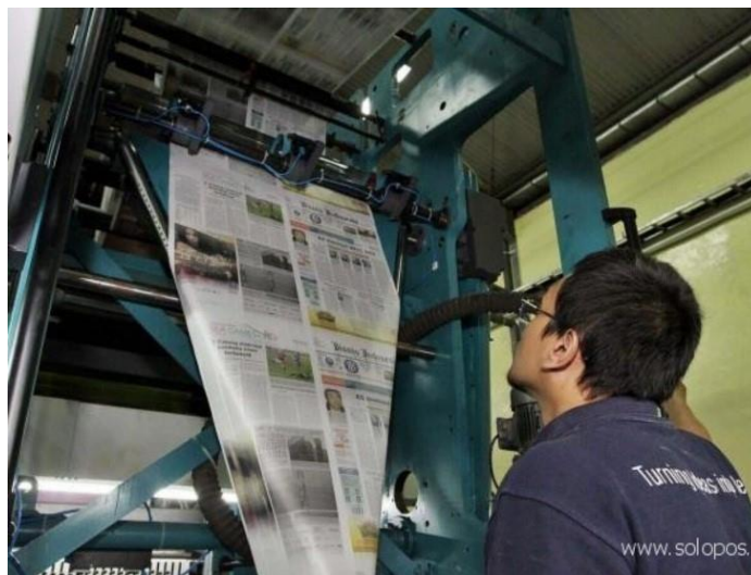
Gambar 3.7 Pencetakan Koran

Pemanfaatan komputer pada bidang jasa seperti percetakan koran atau majalah. Dimana semua pencetakan yang digunakan dengan mesin yang dimotori oleh komputer terprogram.