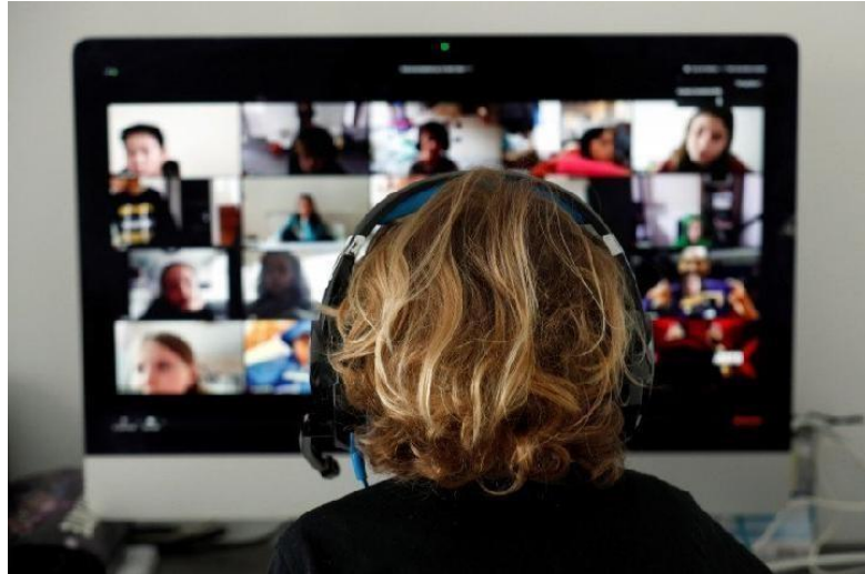
Gambar 3.3 E-Learning

berpengaruh dan sangat berperan aktif dalam bidang pendidikan. Dimana yang kita tahu sekolah sekarang akibat dampak virus COVID-19 siswa tidak dapat belajar bertatap muka langsung dalam kelas tetapi menggunakan metode e-learning atau belajar dari rumah masing masing seperti gambar dibawah ini :